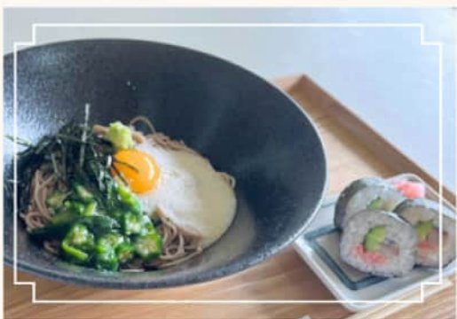
ねばとろそばと 鯖の巻き寿司 1320円