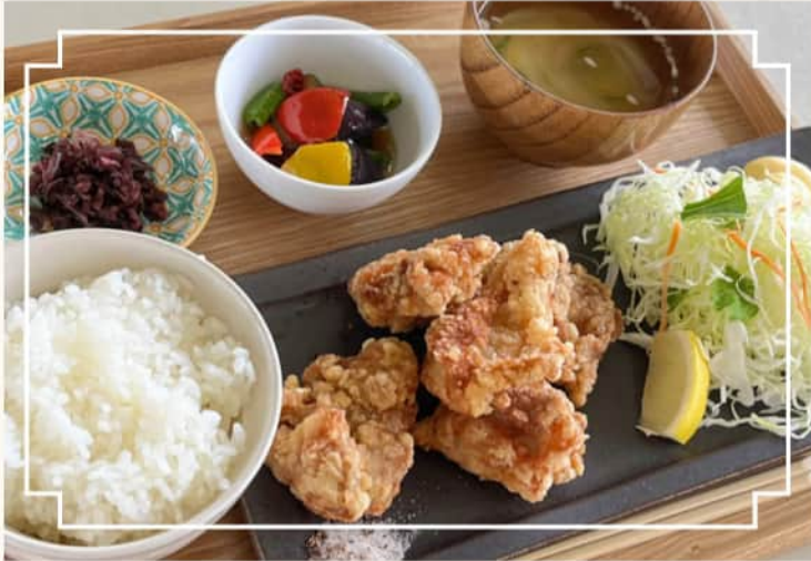
鶏のから揚げ定食