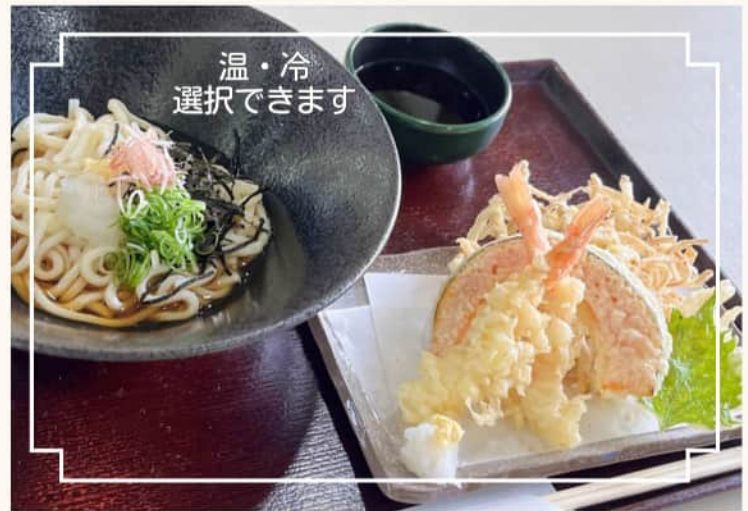
天ぷら盛り合わせと うどんのセット 1320円